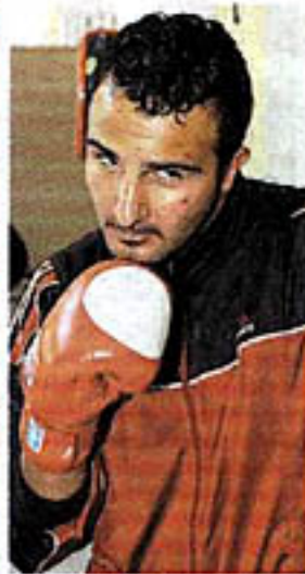
... „Big Brother“ Ali verprügeln