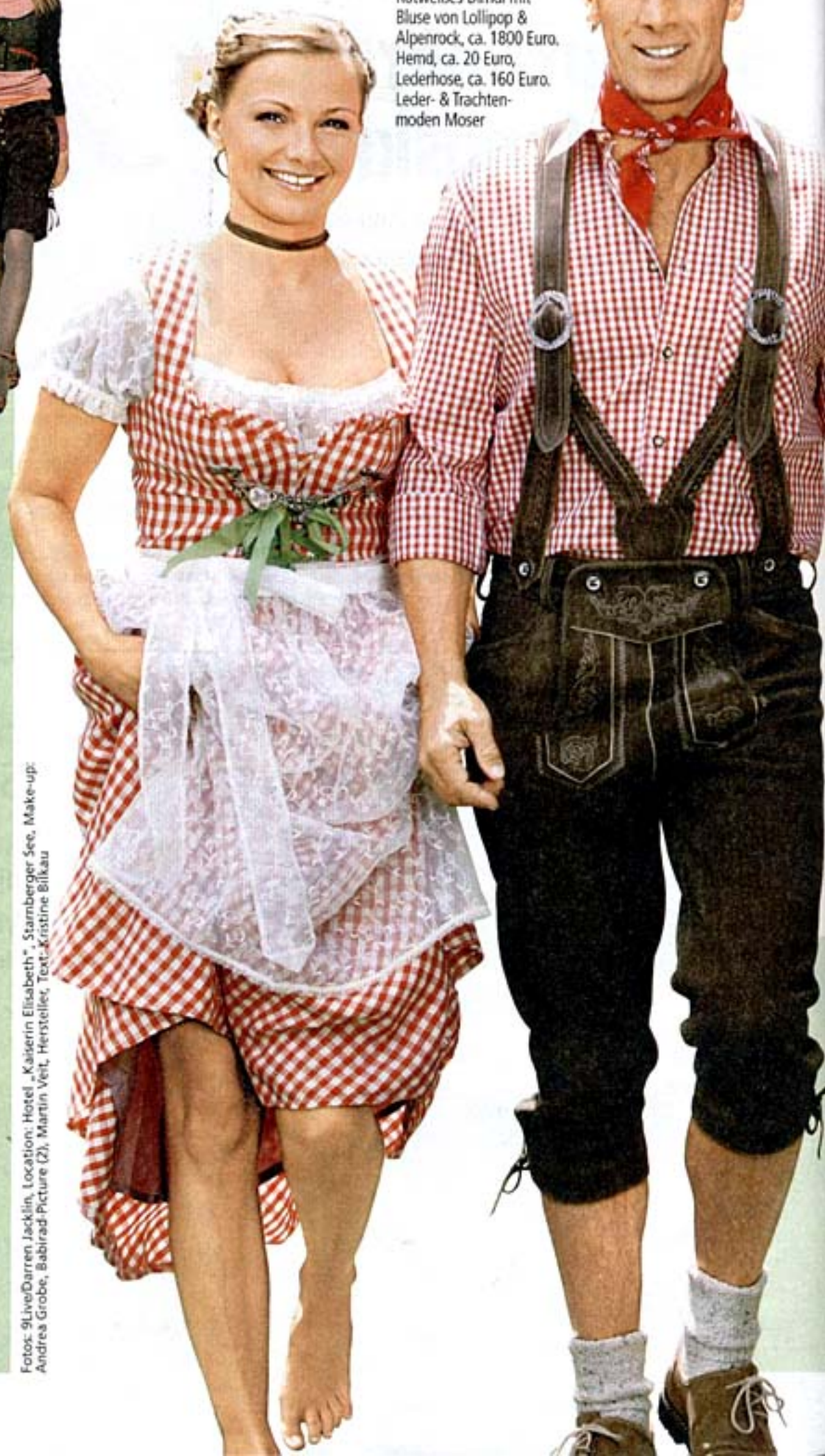
Fotos: 9Live/Darren Jacklin, Location: Hotel „Kaiserin Elisabeth“, Starnberger See, Make-up: Andrea Grobe, Babirad-Picture (2), Martin Veit, Hersteller, Text: Kristine Bilkau

Rotweißes Dirndl mit Bluse von Lollipop & Alpenrock, ca. 1800 Euro. Hemd, ca. 20 Euro, Lederhose, ca. 160 Euro. Leder- & Trachtenmoden Moser